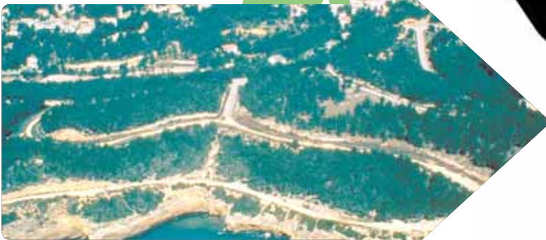
Pla urbanístic aprovat per CiU a Tarragona, al costat de l'espai protegit de la Punta de la Móra (inclòs a la Xarxa Natura 2000).